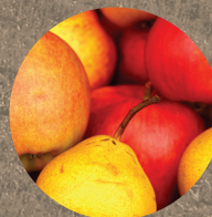
peras y manzanas