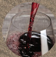
vino y mosto