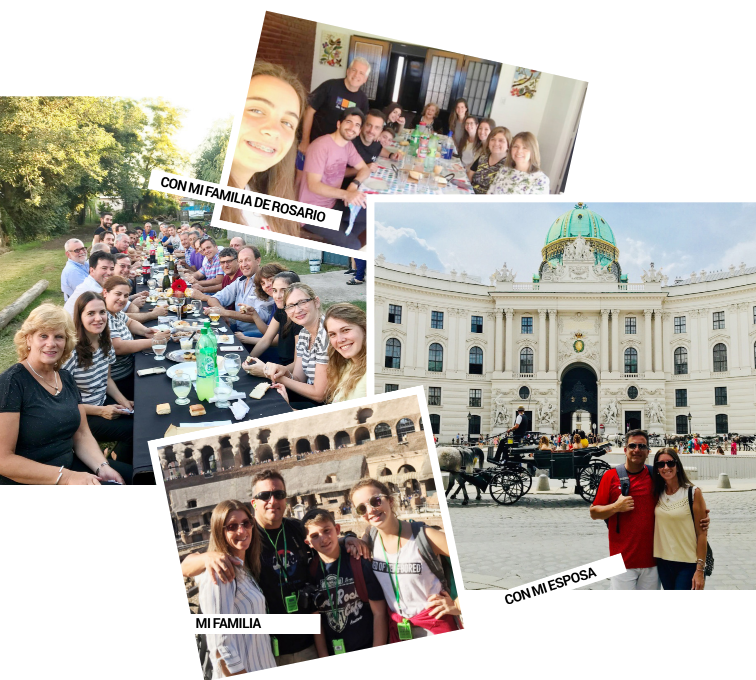
CON MI FAMILIA DE ROSARIO